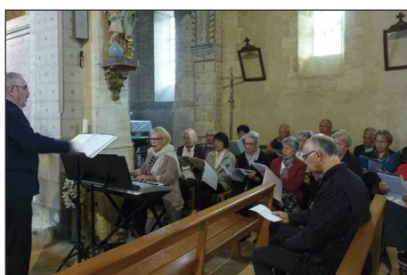
Célébration, chorale A Capella