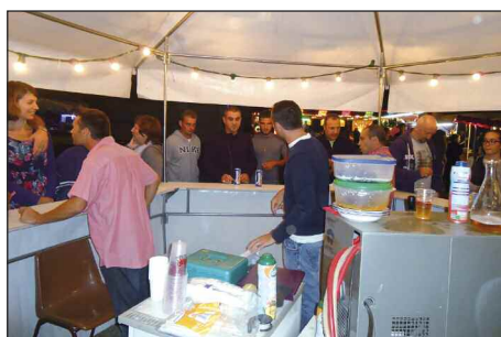
Buvette tenue par l'ASTA