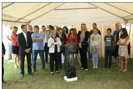
Remise des prix concours photos