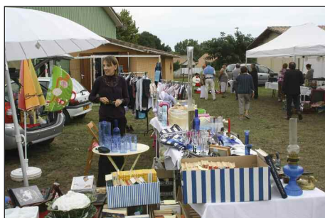
Vide-greniers organisé par l'AGEA