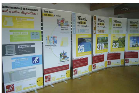
Exposition « Merci pour ces 10 ans de tri »