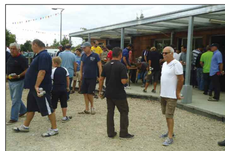
Concours de pétanque