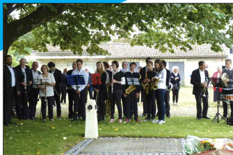
L'Harmonie des Graves