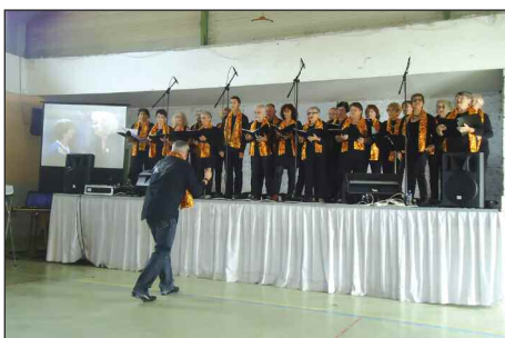
Chorale Brin de chants