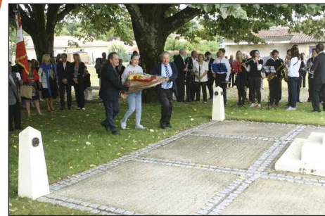
Dépôt de gerbe