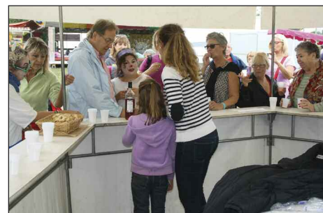
Dégustation château Lusseau