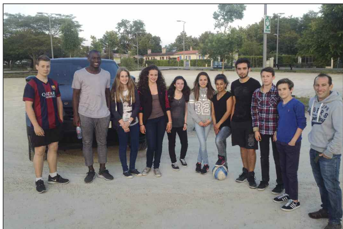
Le temps d'une pause photo et de quelques questions devant son monstrueux bolide.