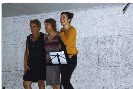
Solistes A l'UNICOEUR