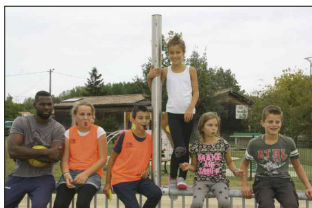
Jeux collectifs animés par le CMJ