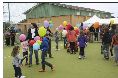
Lâcher de ballons