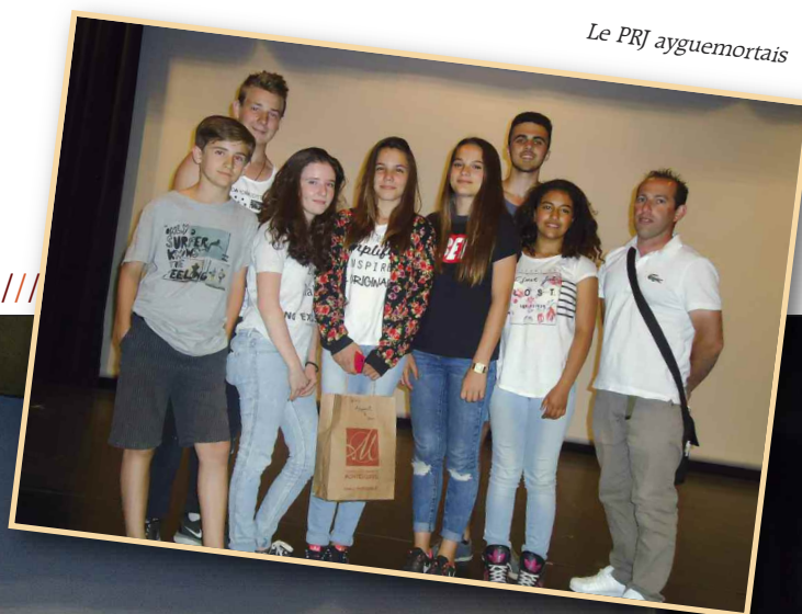
Le PRJ ayguemortais

Les applaudissements nourris du public ont largement salué ce court métrage de grande qualité.