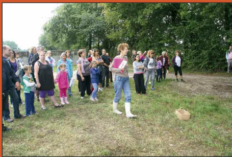
Balade découverte avec l'association ICARE