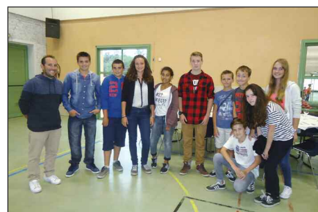
Service assuré par le PRJ

Autre moment majeur, la fête locale qui cette année s'est enrichie de nouveautés avec entre autres :